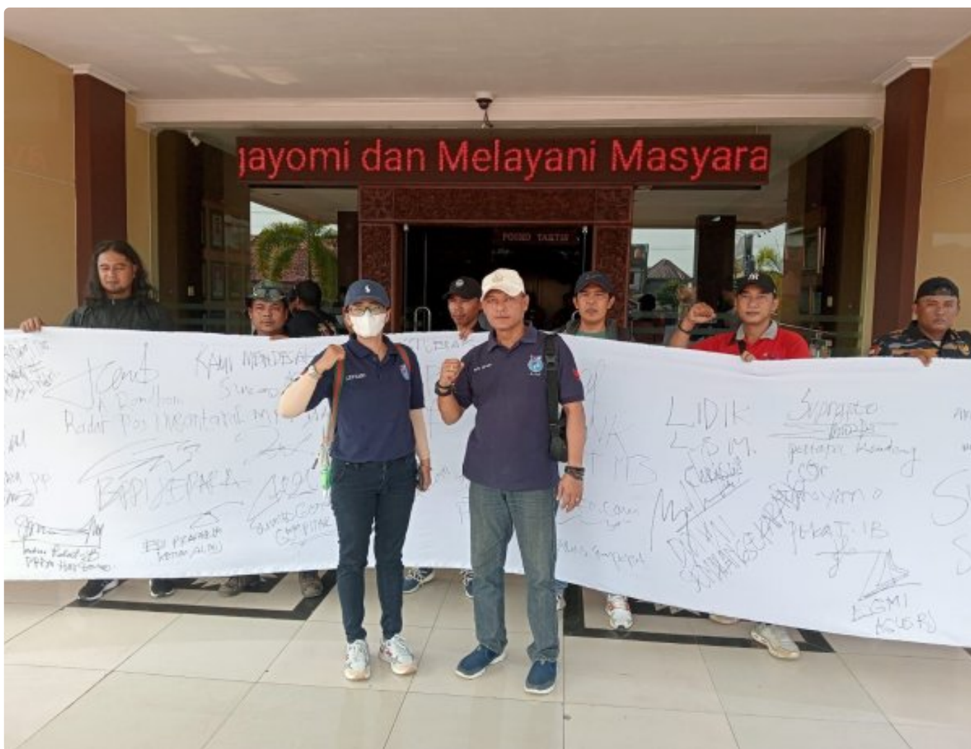
(Foto Dokumen): Para Aktivis Jepara Beraksi atas Masalah Dugaan Sikap Oknum Kepala Desa Lebak Arogan dan Pelecehan Terhadap Wartawan Saat Bertugas Peliputan Masa Perpanjangan Jabatan Kades di Pendopo Kabupaten Jepara, Jawa Tengah.